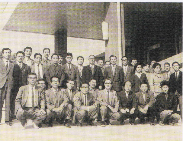
開校当時の職員集合写真（通信制）