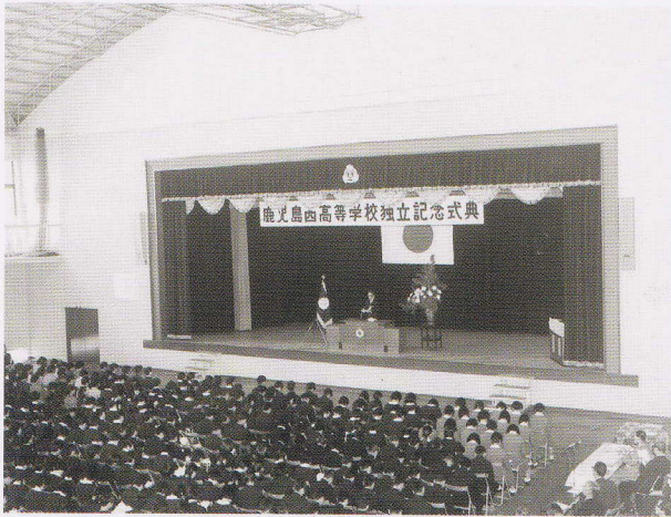
独立記念式典（昭和44年11月）