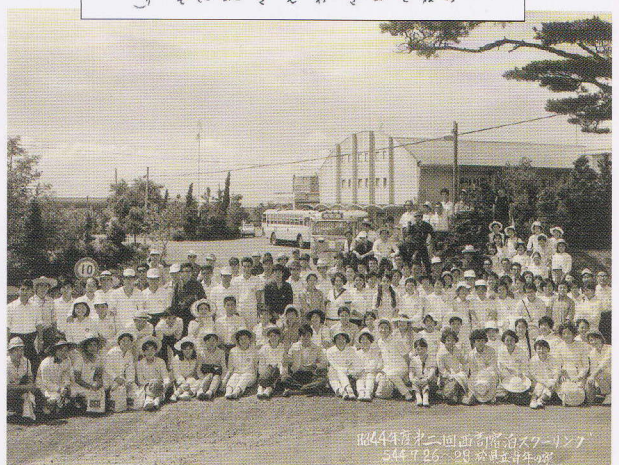
宿泊スクーリング（通信制）